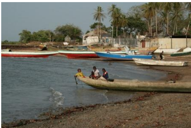
Hamnen med fiskebåtar, urholkade trädstammar.