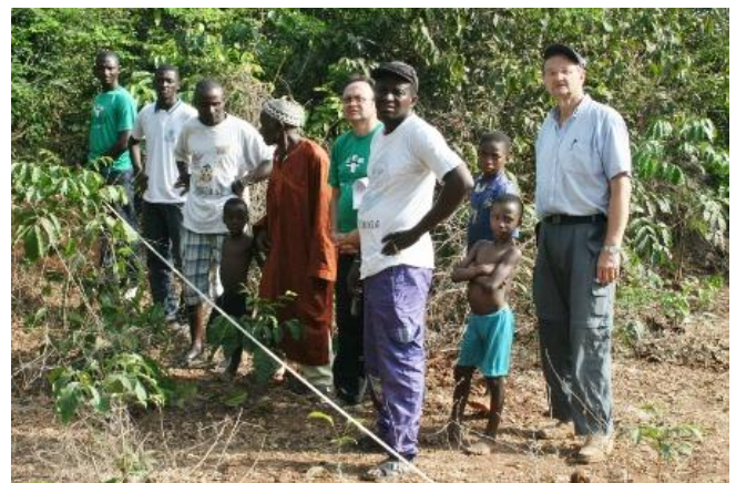
Marken till radiostationen mäts ut.