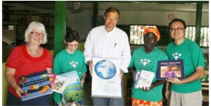
Biblioteket i skolan