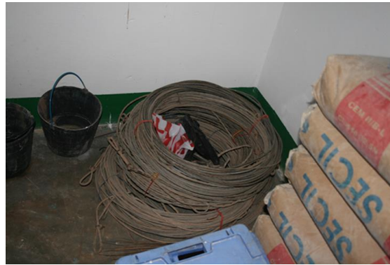
Kablar och sladdar