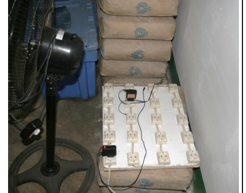
Kopplingsdosor och cement