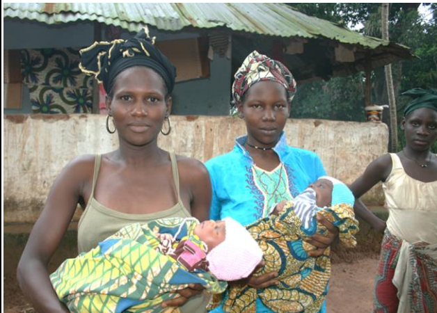
Nyfödda i byn Bonia med babyhjälm

med en fotbollsklubb som kan hjälpa till? Hör av er! Spelarna var hur duktiga som helst och kände till Zlatan, Messi, Ronaldo och alla andra stora. Fotboll är stort!