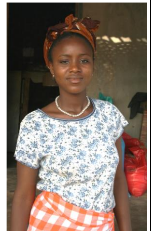
Fint med halsband!

Den här gången hade många skänkt bl.a smycken, slipsar, scarfar, glasögon, handstickade babymössor och tröjor. Allt oerhört uppskattat Ett stort tack till givarna från mottagarna!! Nästa gång tar vi gärna med glasögon, solcellslampor, fotbollskläder, fotbollar, svarta herrbyxor till eleverna i klass 10 och 11. Allt behövs, så det går bra att höra av sej.