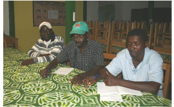
Några från fotbollsklubbens styrelse

Den här gången ville fotbollsklubben i Cacine träffa oss. De vill komma upp till en högre nivå i Guinea-Bissau, men då måste de ha likadana fotbollskläder. Nu ”bollar” vi frågan vidare till er läsare. Har någon kontakt