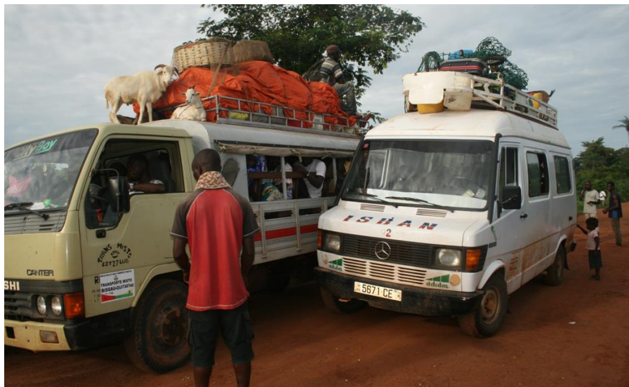
Vår buss till höger. Getter och annat bagage lyfts över till nästa buss