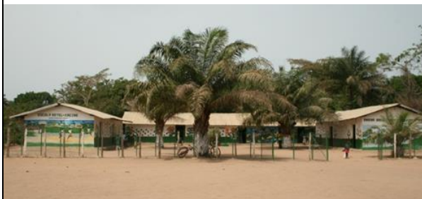
Skolan i Cacine