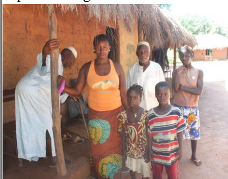
"Homem grande" som skänkte marken"