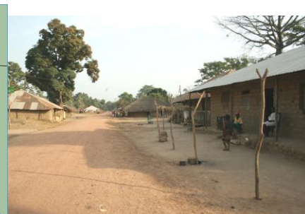
En av bygatorna i Cacine