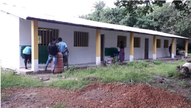
Den nya skolbyggnaden för åk 12 är på plats