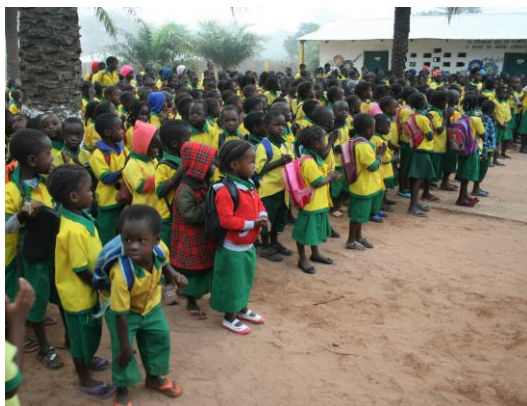
Förskoleklassen hälsar oss välkommen.

TACK för alla riktiga gåvor och elevavgifter under 2019-2020! 60 elevavgifter har betalats in som har gått till barn som annars inte hade kunnat gå i skolan. Nu kan de få gå i en välfungerande skola med 790 elever. Under 2019 har vi skänkt pengar till en ny skolbyggnad, som har tagits i bruk för år 12. I början av 2020 har vi dess-