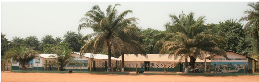
Skolan i Cacine med fotbollsplanen