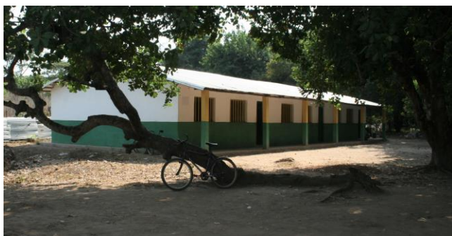
Nya skolbyggnaden för år 12